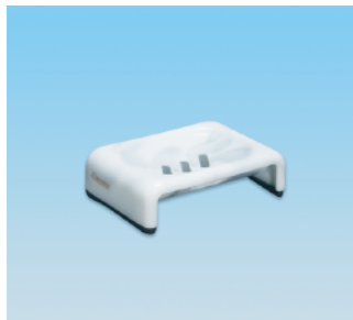
セッケンホルダー / E X ●価格:1,800円 ●サイズ:150×103×39 ●入数:40 ●材質:ポリプロピレン POS/ [W]566488