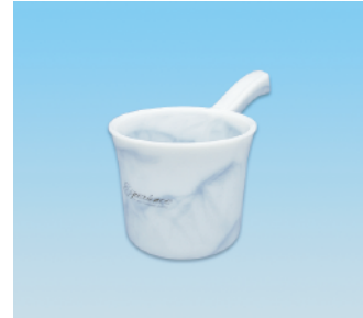
手桶 / E X ●価格:2,300円 ●サイズ:145φ×270×148 ●入数:60 ●材質:ポリプロピレン POS/ [W]576487