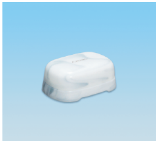
セッケンケース / E X ●価格:800円 ●サイズ:120×83×38 ●入数:90 ●材質:ポリプロピレン POS/ [W]575480