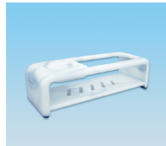
シャンプーデッキ / E X ●価格:3,500円 ●サイズ:366×140×110 ●入数:20 ●材質:ポリプロピレン POS/ [W]565481